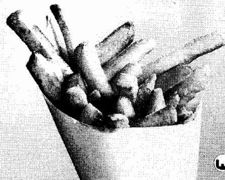
Aardappel m (-s, -en) De aardappel is afkomstig uit Peru en werd in het midden van de 16de eeuw door de Spanjaarden naar Europa overgevoerd. Knol van een kruidachtige plant.